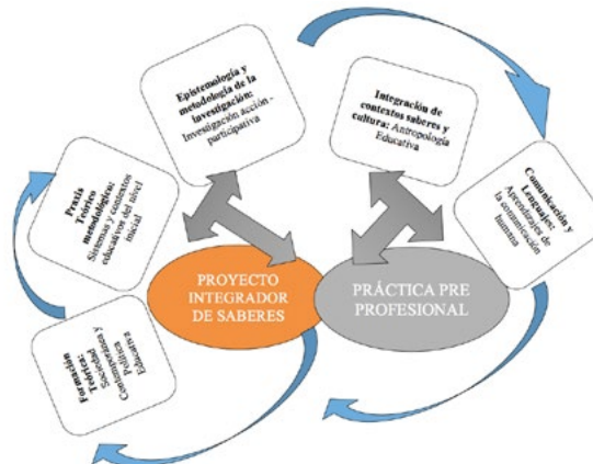
Gráfico 3. Proyecto integrador de saberes, los aportes disciplinares y la práctica pre profesional en la malla curricular.