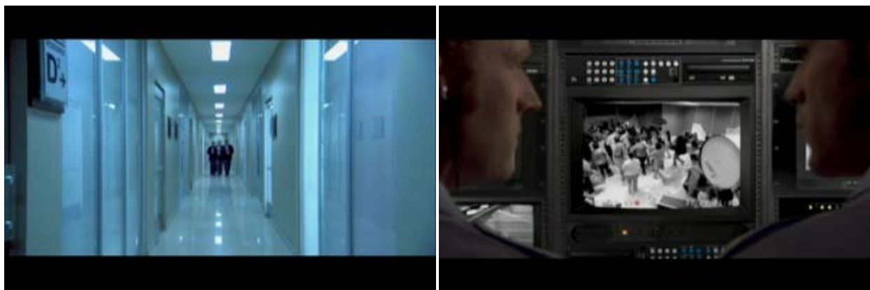
Figura 2. Locaciones en Prometeo deportado , exteriores de la sala de espera.