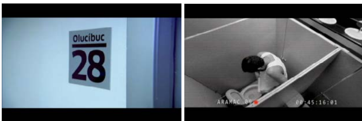
Figura 3. Locaciones en Prometeo deportado , señalética del aeropuerto y textos en dispositivos.