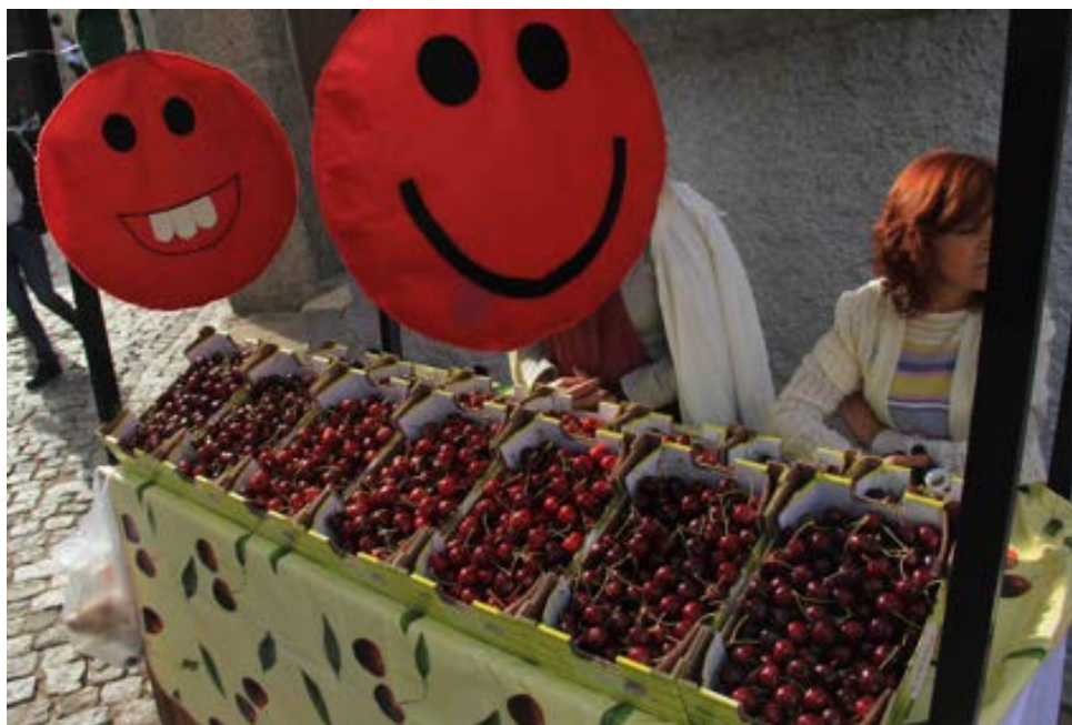
Puesto de cerezas y sus adornos