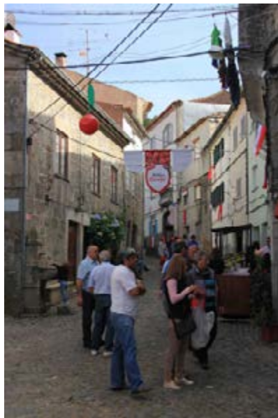
Calles adornadas en Alcongosta-Fundão