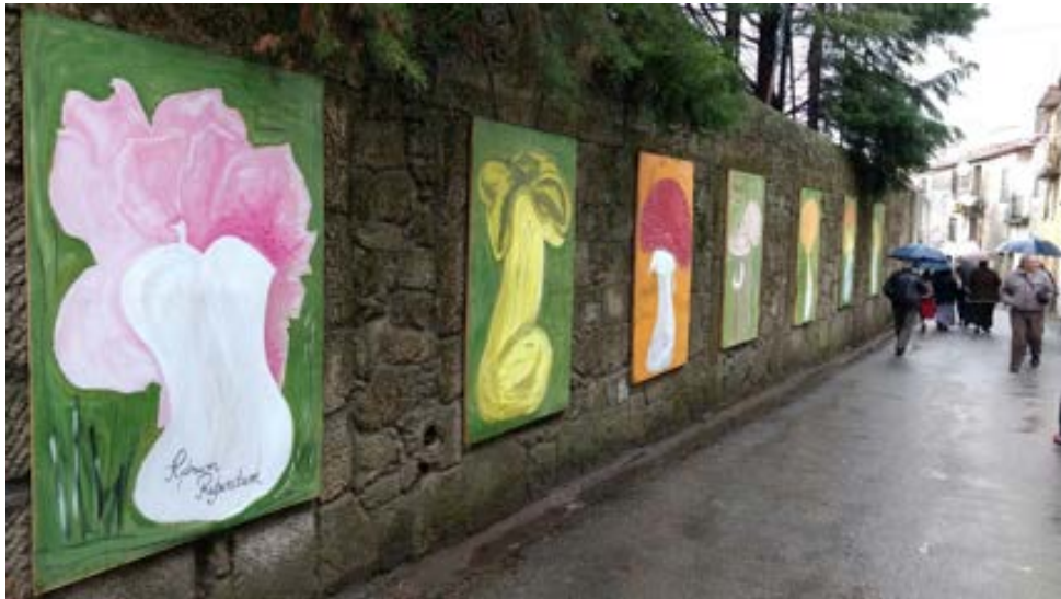
Cuadros con distintas especies de setas que adornan las calles