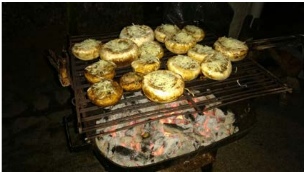
Champiñones a la brasa en un puesto callejero