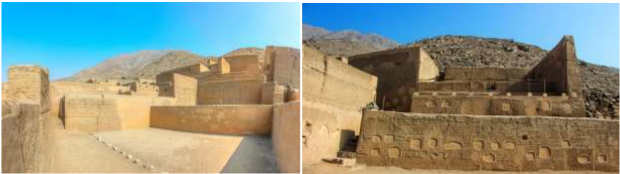
Figura 3. Palacio de Guayacán de Pariachi